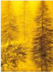
28 / Val Tuors Okt 1987 31x44 Oelkreide Barit Fr. 60.00