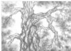
10 / Föhre Bonaduz Dez 1987 44x31 Oelkreide Barit Fr. 60.00