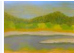
12 / Föhre Bonaduz Aug 1988 48x35 Oelkreide Barit Fr. 80.00