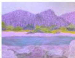
13 / Föhre in der Schneelandschaft März 1988 44x31 Oelkreide Barit Fr. 80.00