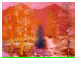
14 / Föhre in der Schneelandschaft März 1988 44x31 Oelkreide Barit Fr. 70.00