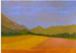
25 / Tschavir Bonaduz Aug 1985 49x31 Oelkreide Barit Fr. 70.00