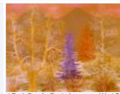
15 / Park Reichenau III 1988 48x35 Oelkreide Barit Fr. 70.00