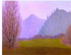
05 / Bonaduz August III 1985 48x35 Oelkreide Barit Fr. 80.00