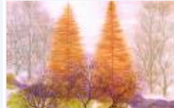
27 / Ulrichen März 1988 50x33 Oelkreide Barit Fr. 60.00