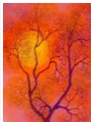
08 / Der Mond April 1988 35x47 Oelkreide Barit Fr. 80.00