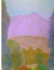
23 / Schloss Reichenau nach Bonaduz Okt 1986 34x44 Oelkreide Barit, verkauft