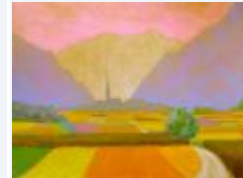
06 / Bonaduz Sept 1985 48x35 Oelkreide Barit verkauft