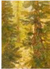
29 / Weg nach Zitail Okt 1987 Oelkreide Büttle Fr. 60.00