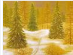
30 / Winter Tscharn nach Bonaduz Okt 1987 47x33 Oelkreide Barit Fr. 70.00