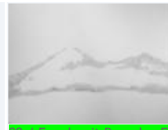
09 / Der Mond Bonaduz Feb 1988 35x47 Oelkreide Barit Fr. 40.00