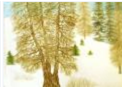
11 / Föhre in der Schneelandschaft März 1988 44x31 Oelkreide Barit Fr. 60.00