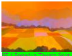
07 / Bonaduz September 1985 48x35 Oelkreide Barit Fr. 70.00