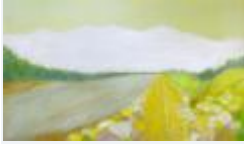
22 / Sargans April 1988 47x28 Oelkreide Barit Fr. 50.00