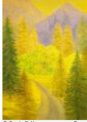
20 / Römerweg Sept 1985 31x43 Oelkreide Barit Fr. 60.00