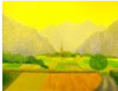
04 / Bonaduz Aug 1985 48x35 Oelkreide Barit Fr. 100.00