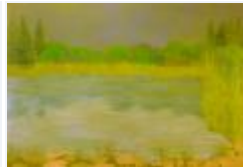
02 / Am Canovasee Aug 1988 48x33 Oelkreide Barit Fr. 60.00