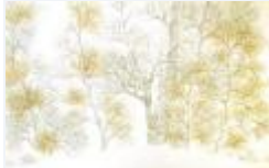
26 / Tschavir Feb 1986 42x30 Oelkreide Barit Fr. 50.00