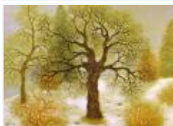
16 / Park Reichenau II 1988 47x34 Oelkreide Barit Fr. 60.00