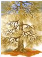
31 / Winter Tscharn nach Bonaduz Okt 1987 47x33 Oelkreide Barit Fr. 80.00