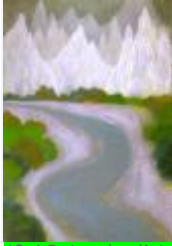
19 / Sargans Sept 1985 31x30 Oelkreide Barit Fr. 70.00