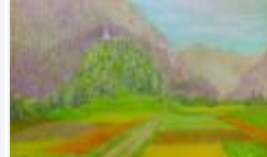
24 / Schloss Reichenau nach Bonaduz Okt 1986 34x44 Oelkreide Barit Fr. 80.00